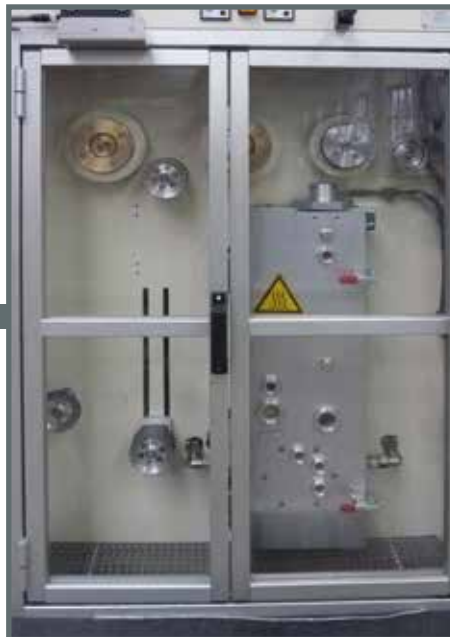
Glühe mit Schutztür